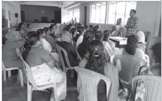
പാനായിക്കുളത്തുവെച്ചു നടത്തിയ ഹെൽത്ത് ക്ലാസ്