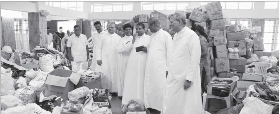
2019 പ്രളയ റിലീഫ് സെന്റർ ആർച്ച്ബിഷപ്പ് സന്ദർശിച്ചപ്പോൾ

കണ്ണൂരിലെ പ്രളയബാധിതപ്രദേശത്തെ കുടുംബങ്ങളെ സഹായിക്കാനായി മൂന്നാമത്തെ ട്രക്ക് ആഗസ്റ്റ് 21-ാം തീയതിയും ആലപ്പുഴയിലെ തകഴിയിലെ കുടുംബങ്ങളെ സഹായിക്കാനായി നാലാമത്തെ കണ്ടെയ്നർ ആഗസ്റ്റ് 22-ാം തീയതിയും ഇ.എസ്.എസ്.എസിൽ നിന്ന് പുറപ്പെട്ടു. ആവശ്യക്കാർക്ക് തക്കസമയത്ത് സഹായമെത്തിച്ചുകൊടുക്കാൻ സന്മനസ്സുള്ള ധാരാളം പേർ സഹായിച്ചു.