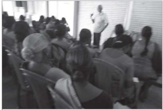
മെന്റൽഹെൽത്ത് ക്ലാസ് തേവർക്കാട്